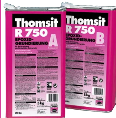
Produsul lunii - Thomsit R750